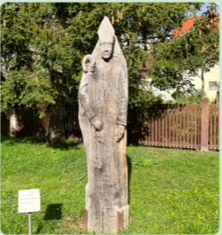
6. Otto von Bamberg Sebastian Bach