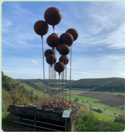
12. Inklusion Günter Noeleke