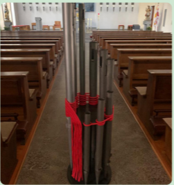
2. Suoni Legati Helmut Droll