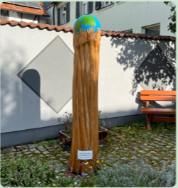
4. Unsere Erde braucht viele schützende Hände Klaus Schneider