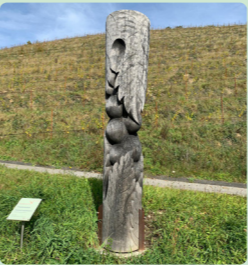
11. Traubensäule Herbert Holzheimer