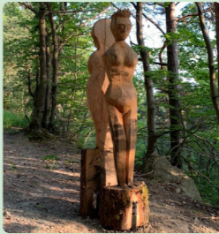
15. Venus vs. Miss Univers Elias Frisch