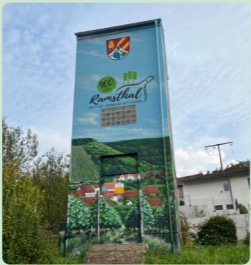
5. Trafostation art-efx