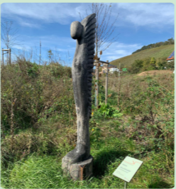
7. Ikarus Klaus Schneider