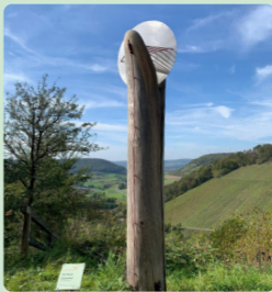
13. Die Cloud Helmut Droll