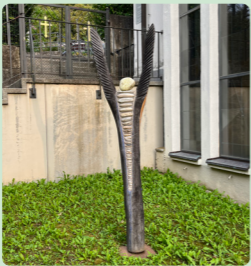
1. Blauer Engel Klaus Schneider

Vielen Dank an alle Sponsoren und Gönner, ohne Sie wäre es nicht möglich dieses Projekt zu verwirklichen.