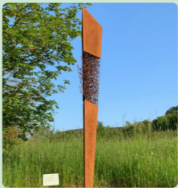
8. Vernetzung Günter Noeleke