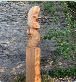
14. Ceratit Kathrin Hubl